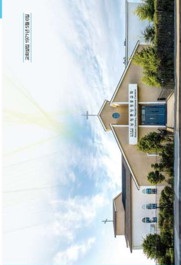
교회소식 1971년 5월 6일

주의 구원이 즐거움을 내게 회복시켜 주시고 지원하는 심령을 주사 나를 불드소서